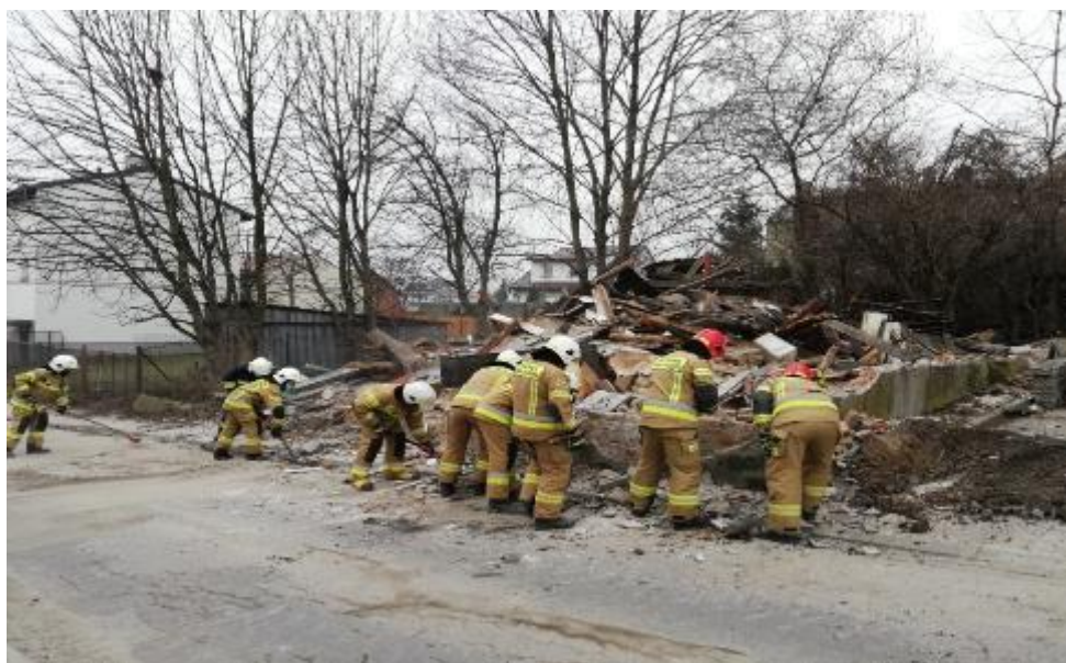
Zdjęcie 4 –Gruzowisko zawalonej ściany domu.