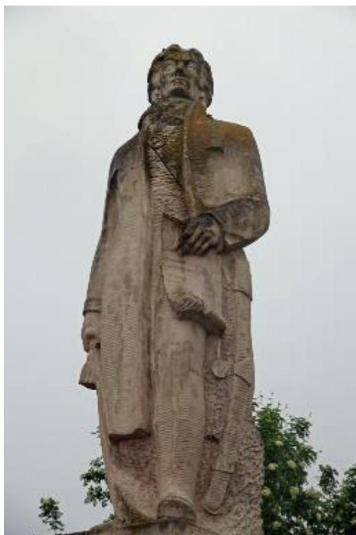
Zdjęcie 2 - Pomnik Tadeusza Kościuszki w Proszowicach – przed pracami konserwatorskimi.