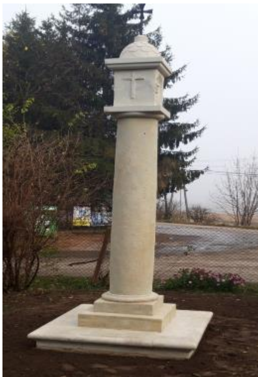
Zdjęcie 1- Odnowiona kapliczka w Szczytnikach.

Całkowity koszt wykonania ratunkowych prac konserwatorskich kamiennej kapliczki słupowej z XVII w. w Szczytnikach to 22 537,41 zł. Prace konserwatorskie zostały odebrane w obecności przedstawicieli Małopolskiego Wojewódzkiego Konserwatora Zabytków w Krakowie.