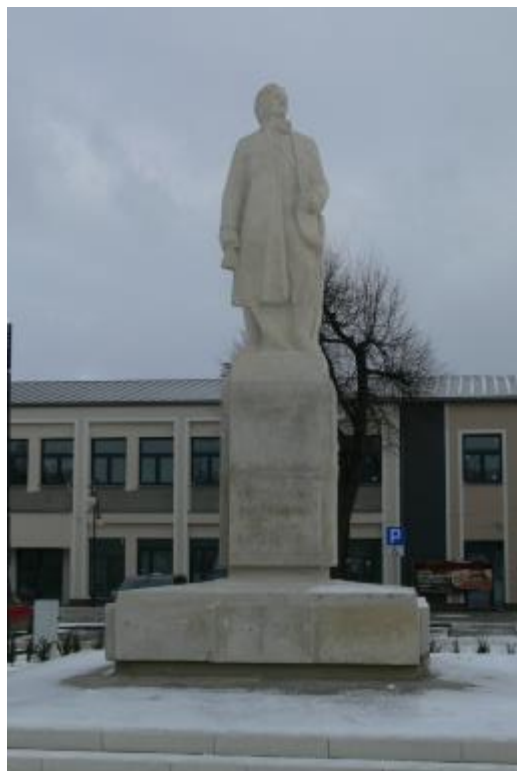
Zdjęcie 3 - Pomnik Tadeusza Kościuszki w Proszowicach – po wykonaniu prac konserwatorskich.