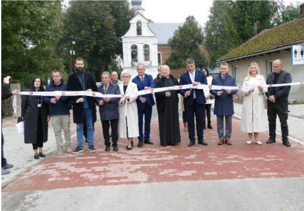
Zdjęcie 1. Uroczyste otwarcie drogi gminnej nr 160311K (Żębocin – Dobranowice)