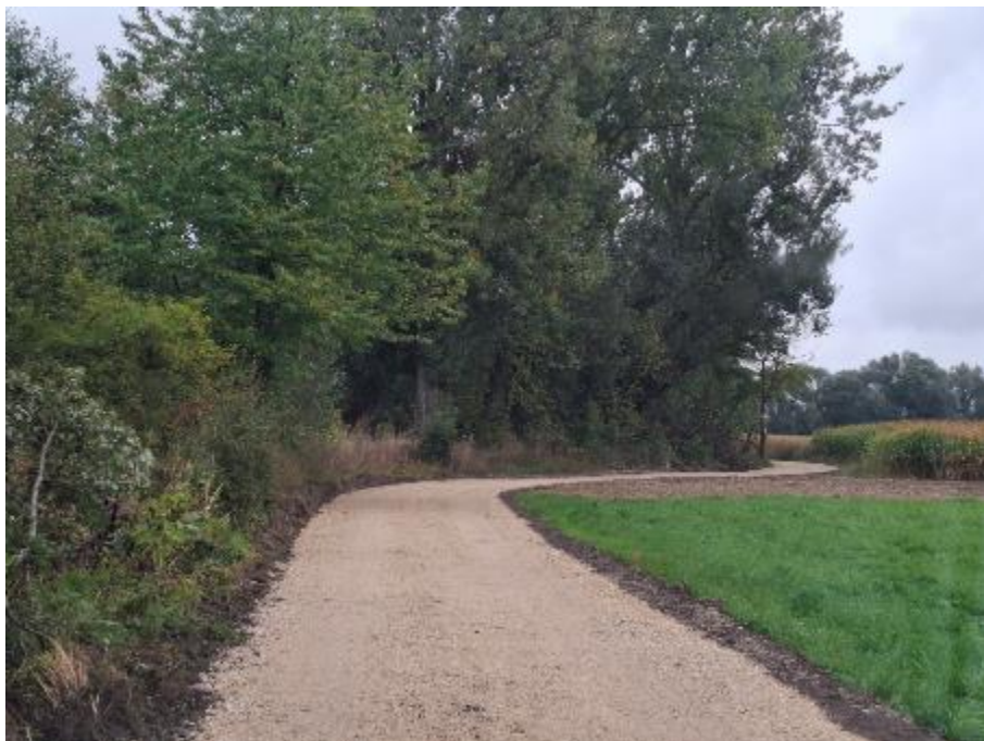
Zdjęcie 14. Piekary rz. Szreniawa nr działki 457 w miejscowości Piekary

4. Droga dojazdowa: Piekary rz. Szreniawa nr działki 457 w miejscowości Piekary.