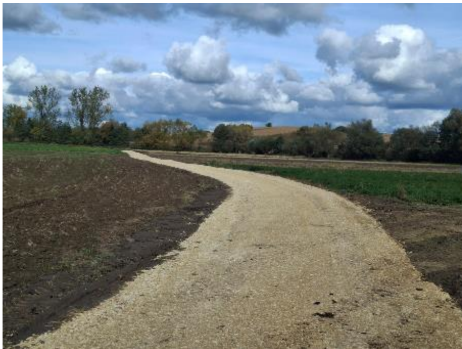
Zdjęcie 19. Stogniowice (Jaz) nr działki 599, 228/1, 251/1, 250/1, 249/1, 248/1, 247/1 w miejscowości Stogniowice

9. Droga dojazdowa: Stogniowice (Jaz) nr działki 599, 228/1, 251/1, 250/1, 249/1, 248/1, 247/1 w miejscowości Stogniowice.