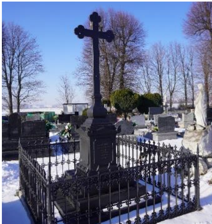
Zdjęcie 10. Żeliwny nagrobek powstańca listopadowego – Szymona Cywińskiego na cmentarzu w Kościelcu – widok po wykonaniu prac konserwatorskich.