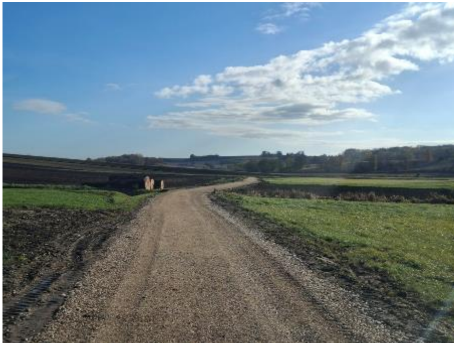
Zdjęcie 13. Kadzice-Janów nr działki 115 w miejscowości Kadzice

3. Droga dojazdowa: Kadzice-Janów nr działki 115 w miejscowości Kadzice.