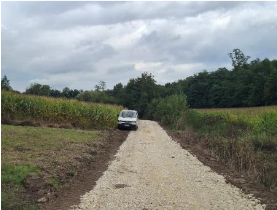
Zdjęcie 11. Bobin do lasu nr działki 500 w miejscowości Bobin

1. Droga dojazdowa: Bobin do lasu nr działki 500 w miejscowości Bobin.