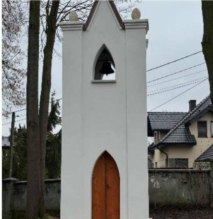
Zdjęcie 8. Dzwonnica po zakończeniu prac konserwatorskich