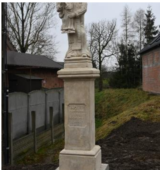
Zdjęcie 5. Kamienna kapliczka św. Jacka w Kościelcu – widok po konserwacji, widok od strony południowej