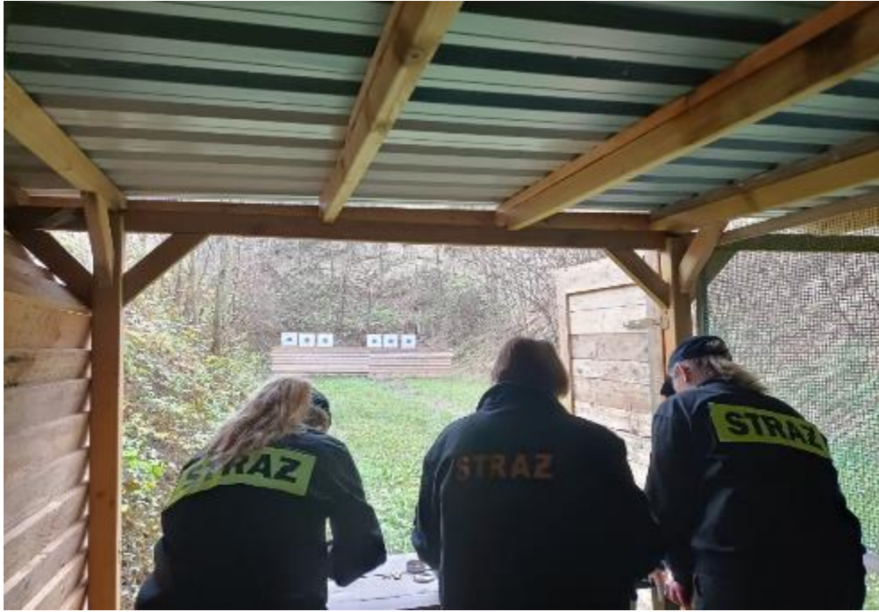
Zdjęcie 21. Turniej Strzelecki Służb mundurowych o Puchar Burmistrza Gminy i Miasta Proszowice na strzelnicy w Gniazdowicach.