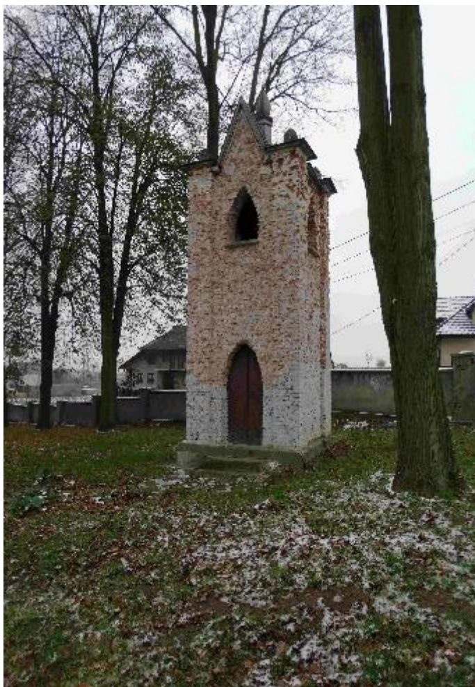
Zdjęcie 7. Dzwonnica w trakcie prac konserwatorskich

Zabytków, oraz na podstawie wniosków Beneficjenta - Parafii Rzymskokatolickiej p.w. Wniebowzięcia N.M.P. w Proszowicach - potwierdzających wykonanie zadania dla realizacji, którego została przyznana dotacja, przekazano Parafii środki w wys. 219 000 zł (wkład własny Gminy Proszowice w wysokości 4 380 zł oraz wysokość przyznanej dotacji z Rządowego Programu Odbudowy Zabytków 214 620 zł w dwóch transzach: 103 435,88 zł i 111 184,12 zł).