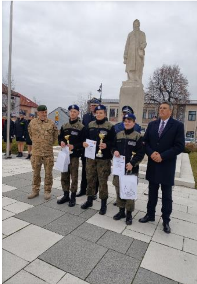
Zdjęcie 20. Wręczenie pucharów dla zwycięzców indywidualnych Zawodów Strzeleckich o Puchar Burmistrza, który odbył się na strzelnicy multimedialnej w Proszowicach.