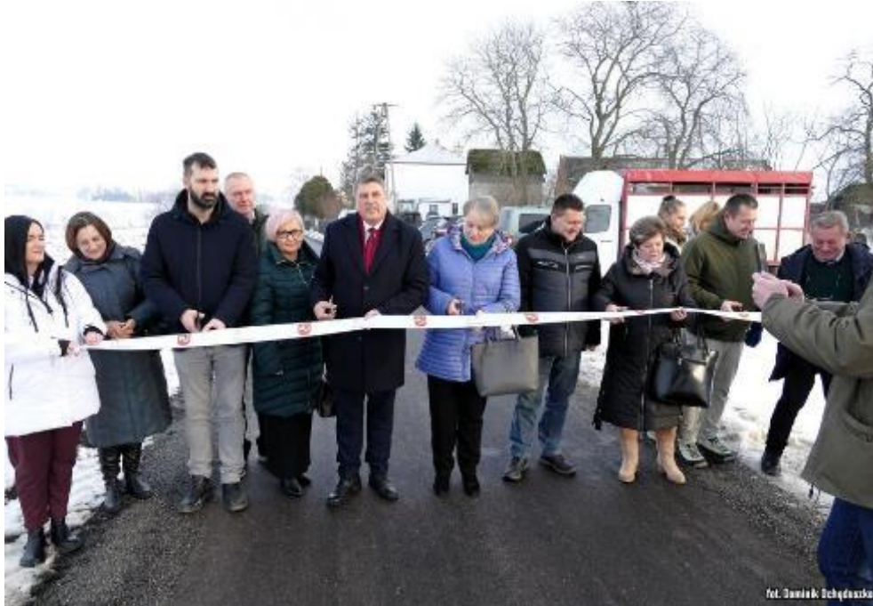
Zdjęcie 3. Uroczyste otwarcie wyremontowanej drogi w Szczytnikach