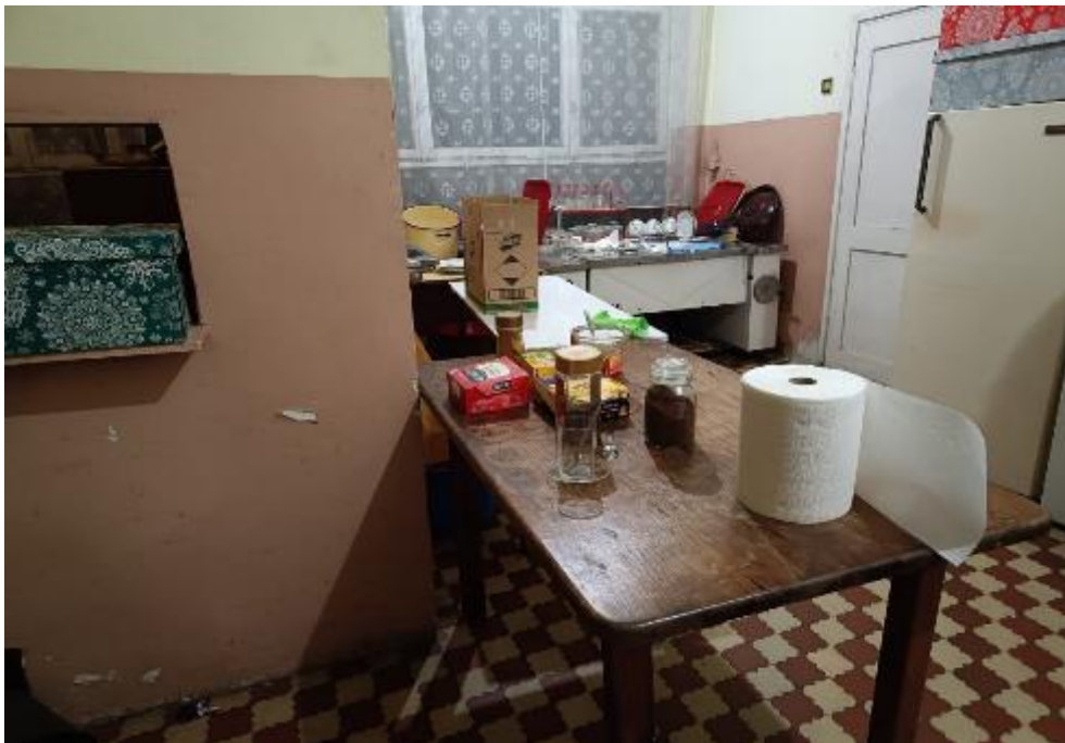
Zdjęcie 25. Pomieszczenie kuchenne świetlicy wiejskiej w Gniazdowicach przed remontem, widok ogólny

Zadanie realizowane w ramach konkursu Małopolskie świetlice wiejskie 2025 ogłoszonego przez Województwo Małopolskie – dofinansowanie 50 000 zł - Umowa nr II/92/RO/2279/25 z dnia 04.06.2025 roku oraz Aneksu nr 1 do ww. umowy z dnia 20.11.2025 roku. Środki stanowiące wkład finansowy Gminy Proszowice: 21 450,08 zł pochodziły z budżetu Gminy Proszowice, w tym z Funduszu Sołeckiego dla wsi Gniazdowice w wys. 10 000 zł z przeznaczeniem na 2025 rok.