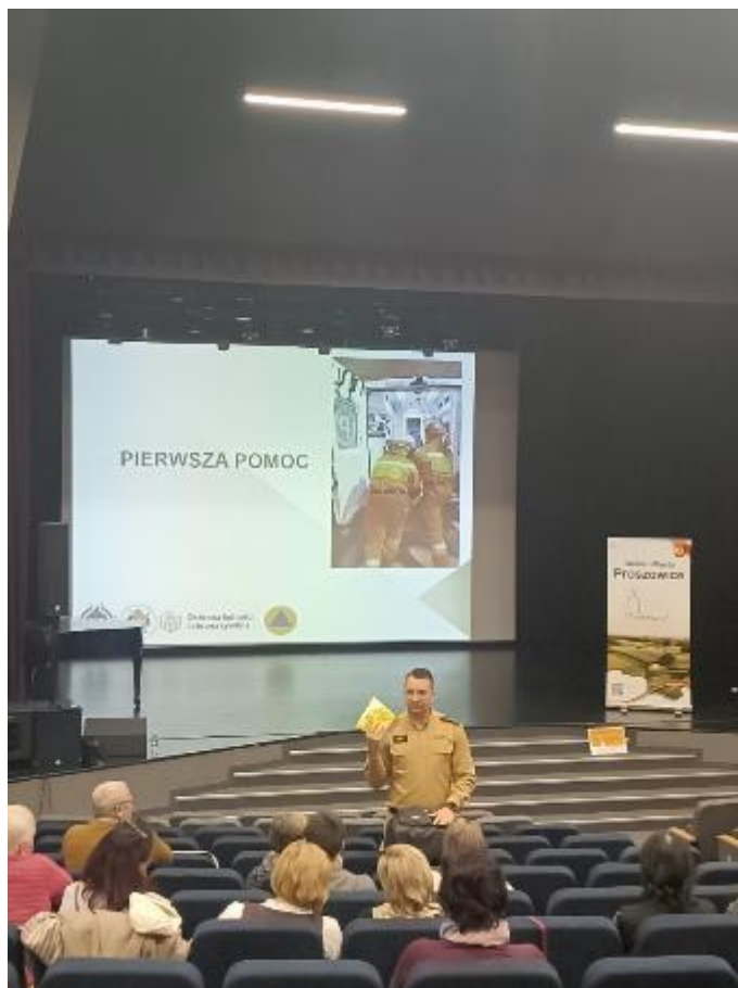
Zdjęcie 23. Szkolenie z zakresu OLiOC dla mieszkańców oraz KGW z gminy Proszowice