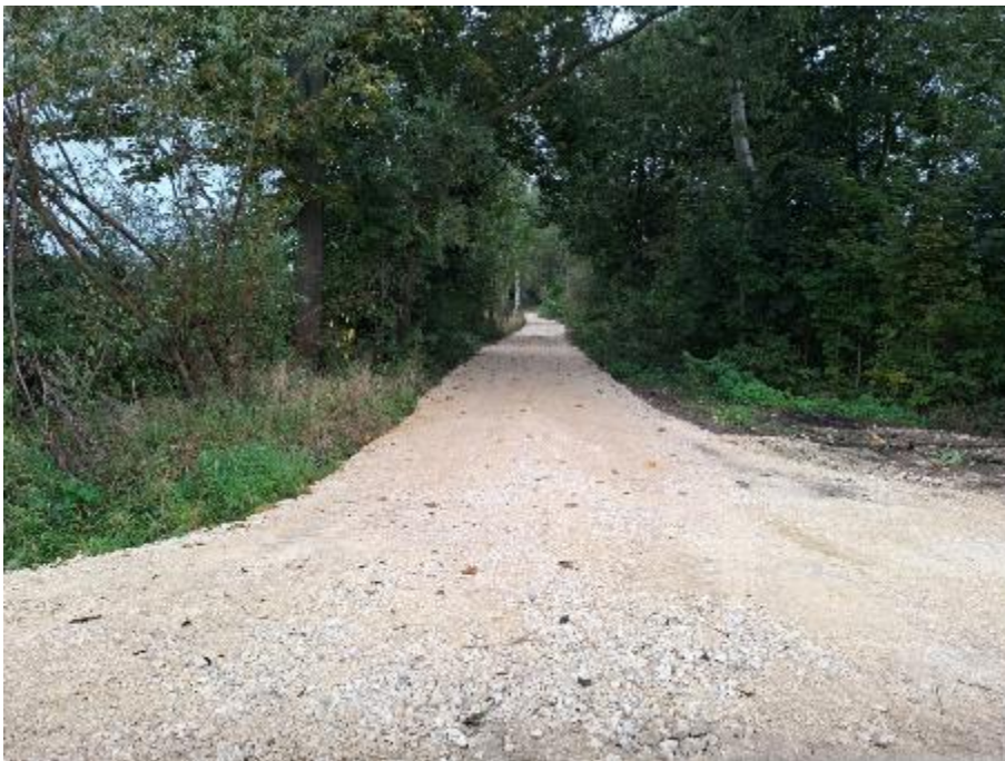
Zdjęcie 12. Czajęczyce (łąki) nr działki 244/1 w miejscowości Czajęczyce

2. Droga dojazdowa: Czajęczyce (łąki) nr działki 244/1 w miejscowości Czajęczyce.