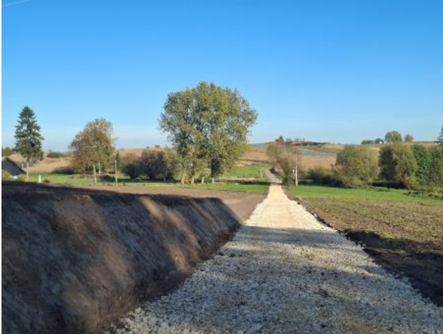
Zdjęcie 15. Szklana-Piotrkowice Małe nr działki 47 w miejscowości Szklana

5. Droga dojazdowa: Szklana-Piotrkowice Małe nr działki 47 w miejscowości Szklana.