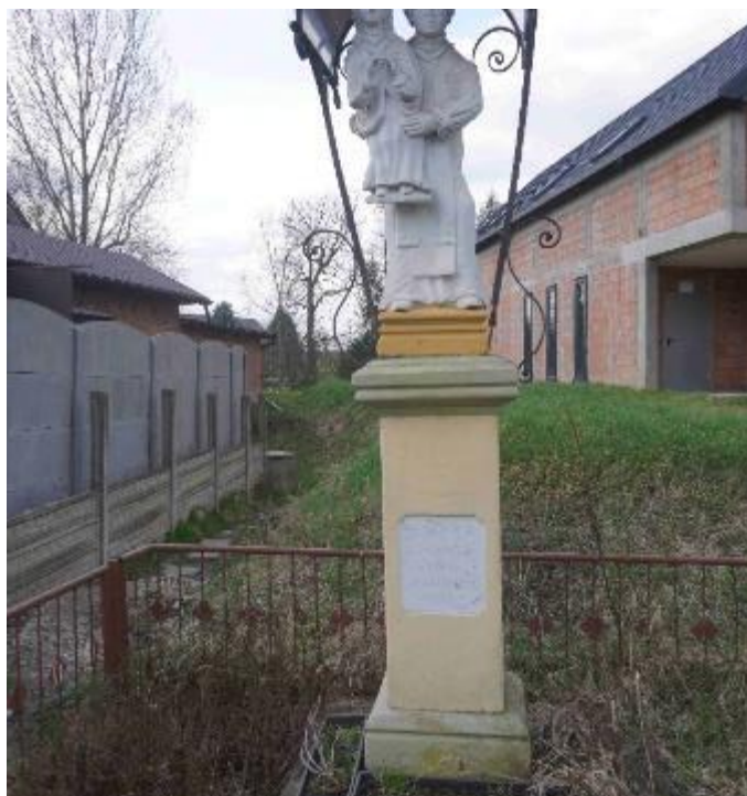
Zdjęcie 4. Kamienna kapliczka św. Jacka w Kościelcu – widok przed konserwacją, widok od strony południowej.