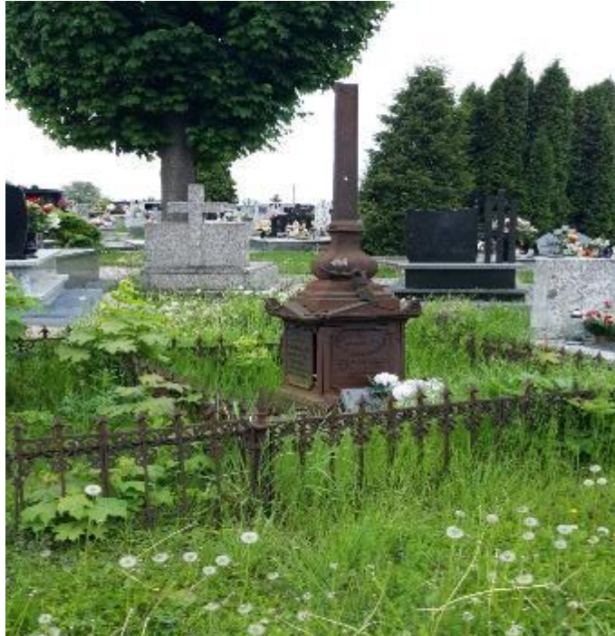
Zdjęcie 9. Żeliwny nagrobek powstańca listopadowego – Szymona Cywińskiego na cmentarzu w Kościelcu – widok przed wykonaniem prac konserwatorskich.