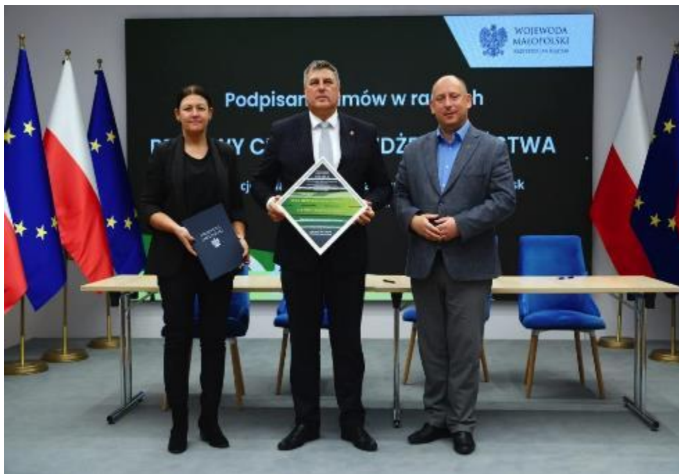
Zdjęcie 2. Podpisanie umowy na realizację zadań