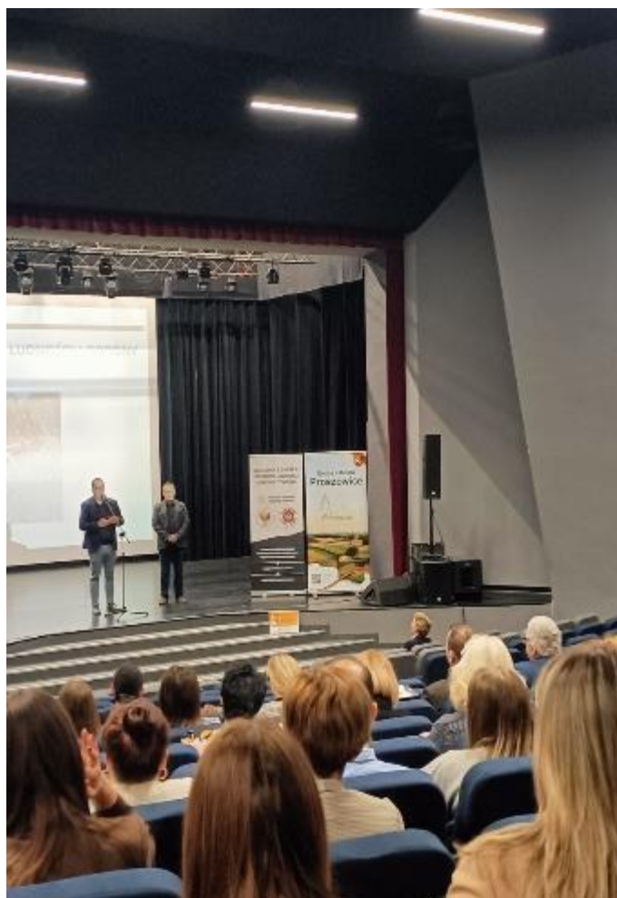
Zdjęcie 22. Szkolenie z zakresu OLiOC dla pracowników Urzędu Gminy i Miasta oraz podmiotów OLiOC