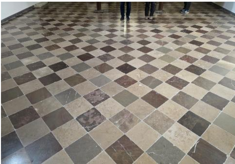
Zdjęcie 6. kamienna posadzka po wykonaniu prac konserwatorskich w kościele św. Stanisława B.M. w Żębocinie .

W związku z podpisaną Umową dotacji nr 513/2024 z dnia 13.09.2024 roku, na realizację inwestycji pn.: „Wykonanie prac budowlano – konserwatorskich w kościele pw. Św. Stanisława B.M. w Żębocinie” w ramach Rządowego Programu Odbudowy Zabytków, zrealizowano zadanie polegające na poddaniu prac konserwatorskich kamiennej nawierzchni posadzi kościoła św. Stanisława wraz z wykonaniem ogrzewania podłogowego. Gmina Proszowice pozyskała dla Parafii Rzymskokatolickiej p.w. św. Stanisława B.M w Żębocinie - dotację, której ostatnia transza została przekazana po odbiorze konserwatorskim zadania potwierdzonym podpisaniem protokołu odbioru konserwatorskiego z udziałem MWKZ w Krakowie – potwierdzającego należyte wykonanie zadania. Wysokość dotacji: 672 192,84 zł (w dwóch transzach: po 336 096,42 zł).