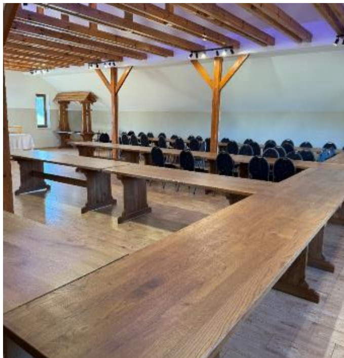
Zdjęcie 24. Wnętrze świetlicy wiejskiej w Posiłowie. Drewniane stoły zakupione do świetlicy wiejskiej w Posiłowie.

Wartość zakupionych materiałów to 21 428,58 zł.