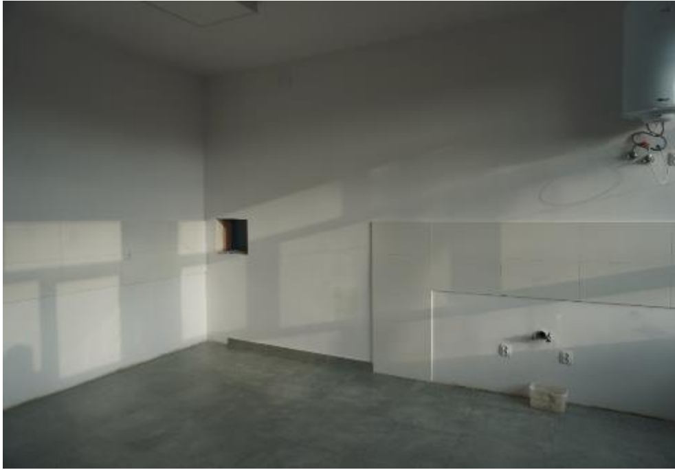
Zdjęcie 26. Pomieszczenie kuchenne świetlicy wiejskiej w Gniazdowicach po generalnym remoncie, widok ogólny