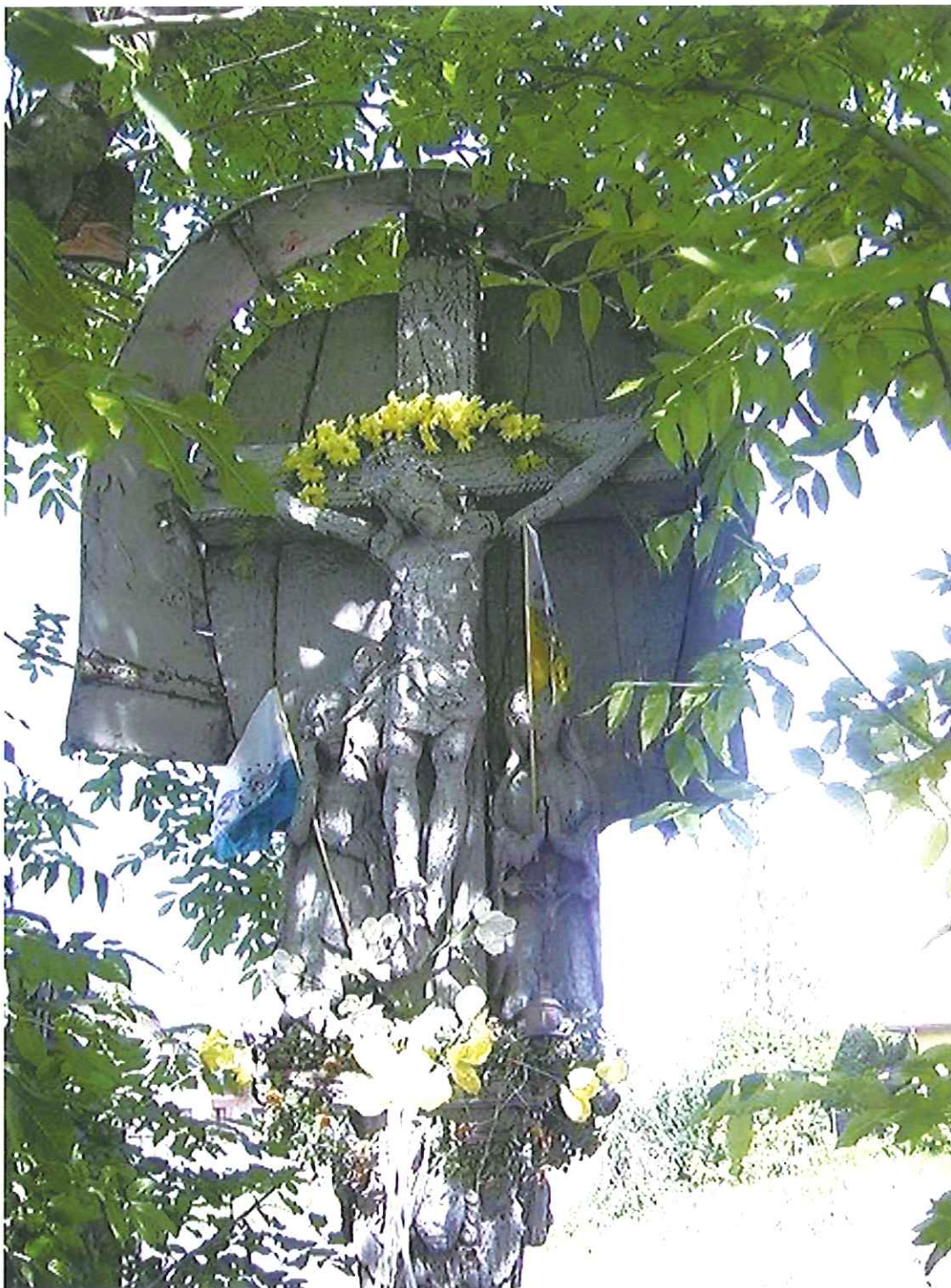
Fot.1. Proszowice, ul. Brodzińskiego. Drewniany krucyfiks z figurami asystencyjnymi. Fragment. Zdjęcie archiwalne 2008-06-01.