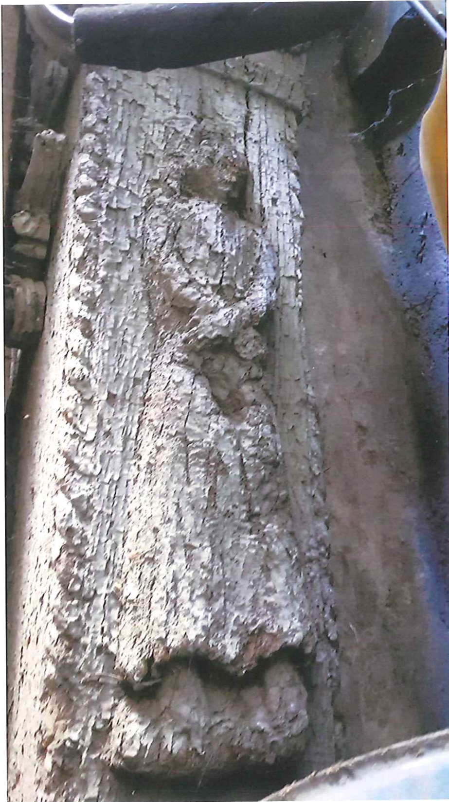
Fot. 17. Proszowice, ul. Brodzińskiego. Drewniany krucyfiks z figurami asystencyjnymi. Fragment. Zdjęcie z 2021 r.