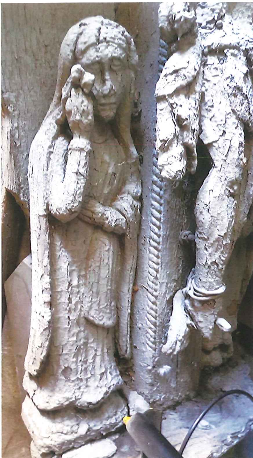
Fot. 12. Proszowice, ul. Brodzińskiego. Drewniany krucyfiks z figurami asystencyjnymi. Fragment. Zdjęcie z 2021 r.