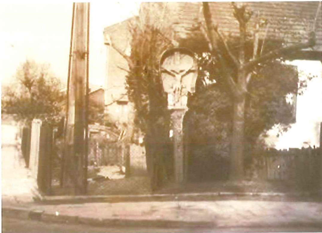
Fot.3. Proszowice, ul. Brodzińskiego. Drewniany krucyfiks z figurami asystencyjnymi. Zdjęcie archiwalne, lata 1960-1970.