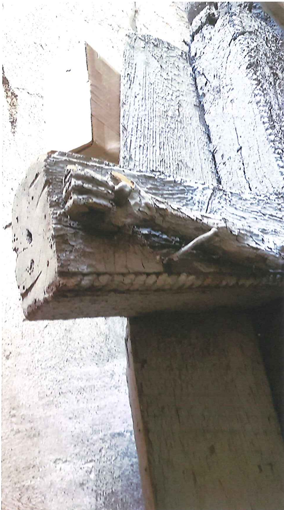
Fot. 14. Proszowice, ul. Brodzińskiego. Drewniany krucyfiks z figurami asydytencyjnymi. Fragment. Zdjęcie z 2021 r.