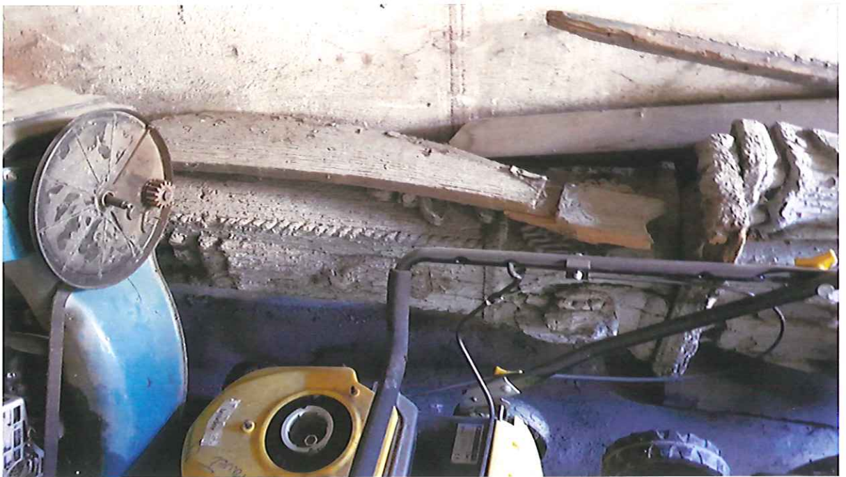
Fot. 10,11. Proszowice, ul. Brodzińskiego. Drewniany krucyfik z figurami asystryjnymi. Fragmenty. Zdjęcia z 2021 r.