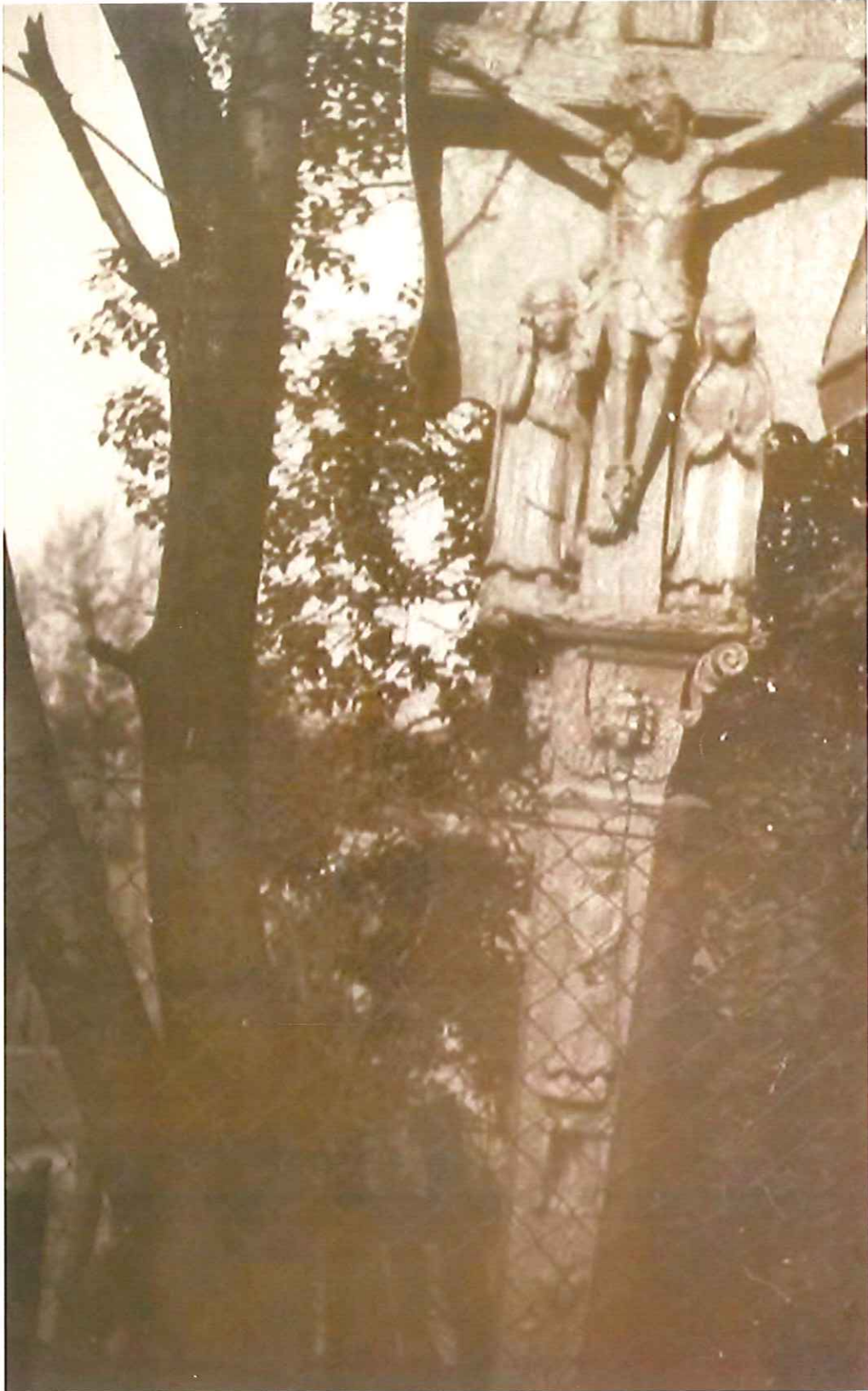
Fot.5. Proszowice, ul. Brodzińskiego. Drewniany krucyfiks z figurami asystencyjnymi. Fragment. Zdjęcie archiwalne, lata 1960-1970.