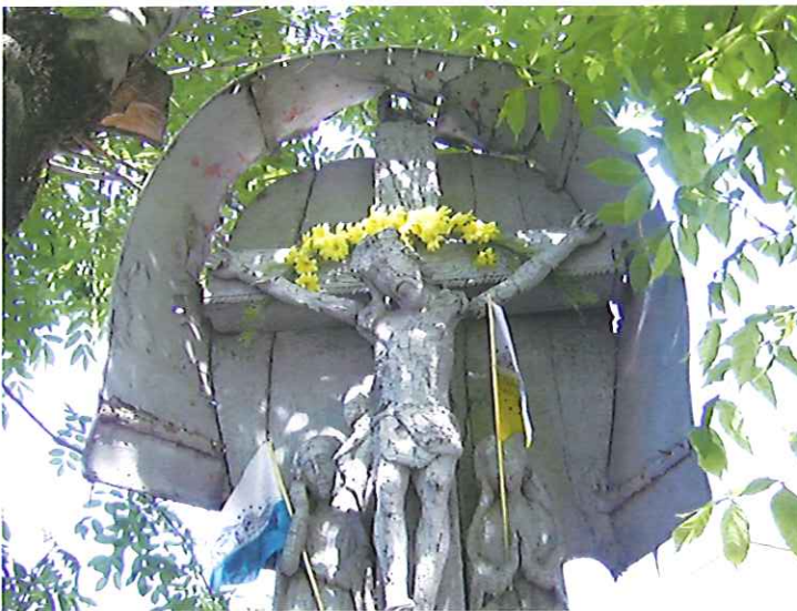
Fot.6,7. Proszowice, ul. Brodzińskiego. Drewniany krucyfiks z figurami asystryntycznymi. Zdjęcia archiwalne 2008-06-01.