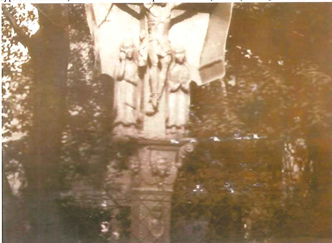
Fot.4. Proszowice, ul. Brodzińskiego. Drewniany krucyfiks z figurami asystencyjnymi. Fragment. Zdjęcie archiwalne, lata 1960-1970.