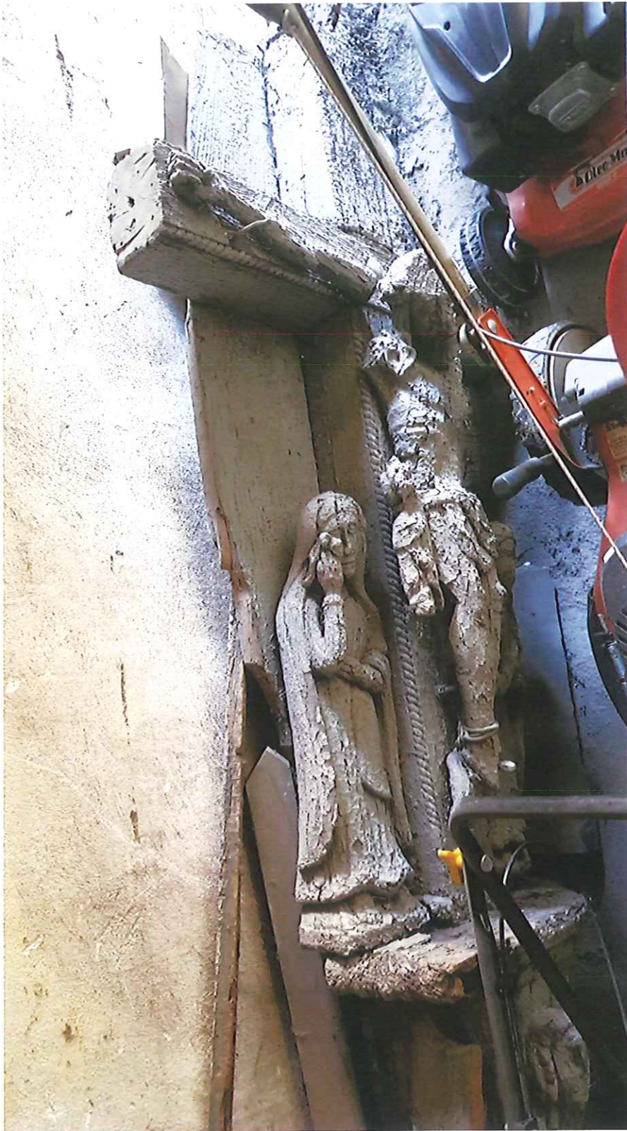
Fot. 9. Proszowice, ul. Brodzińskiego. Drewniany krucyfiks z figurami asystentynymi. Fragment. Zdjęcie z 2021 r.