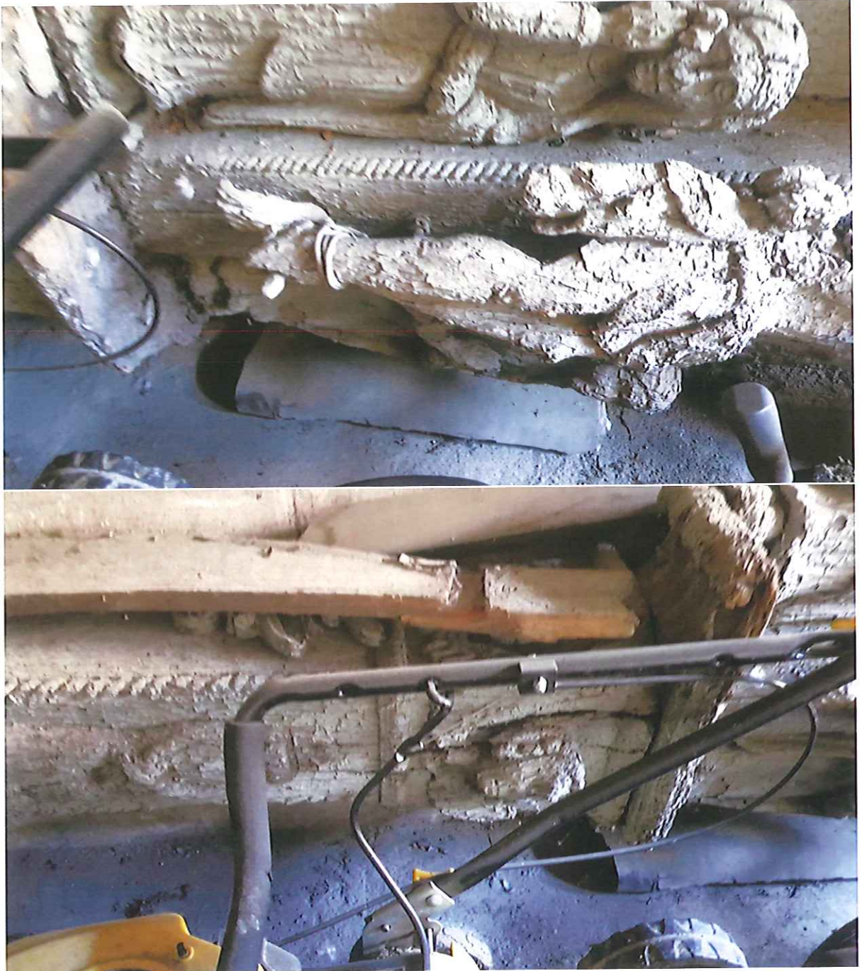
Fot. 15, 16. Proszowice, ul. Brodzińskiego. Drewniany krucyfik z figurami asystrycyjnymi. Fragmenty. Zdjęcia z 2021 r.