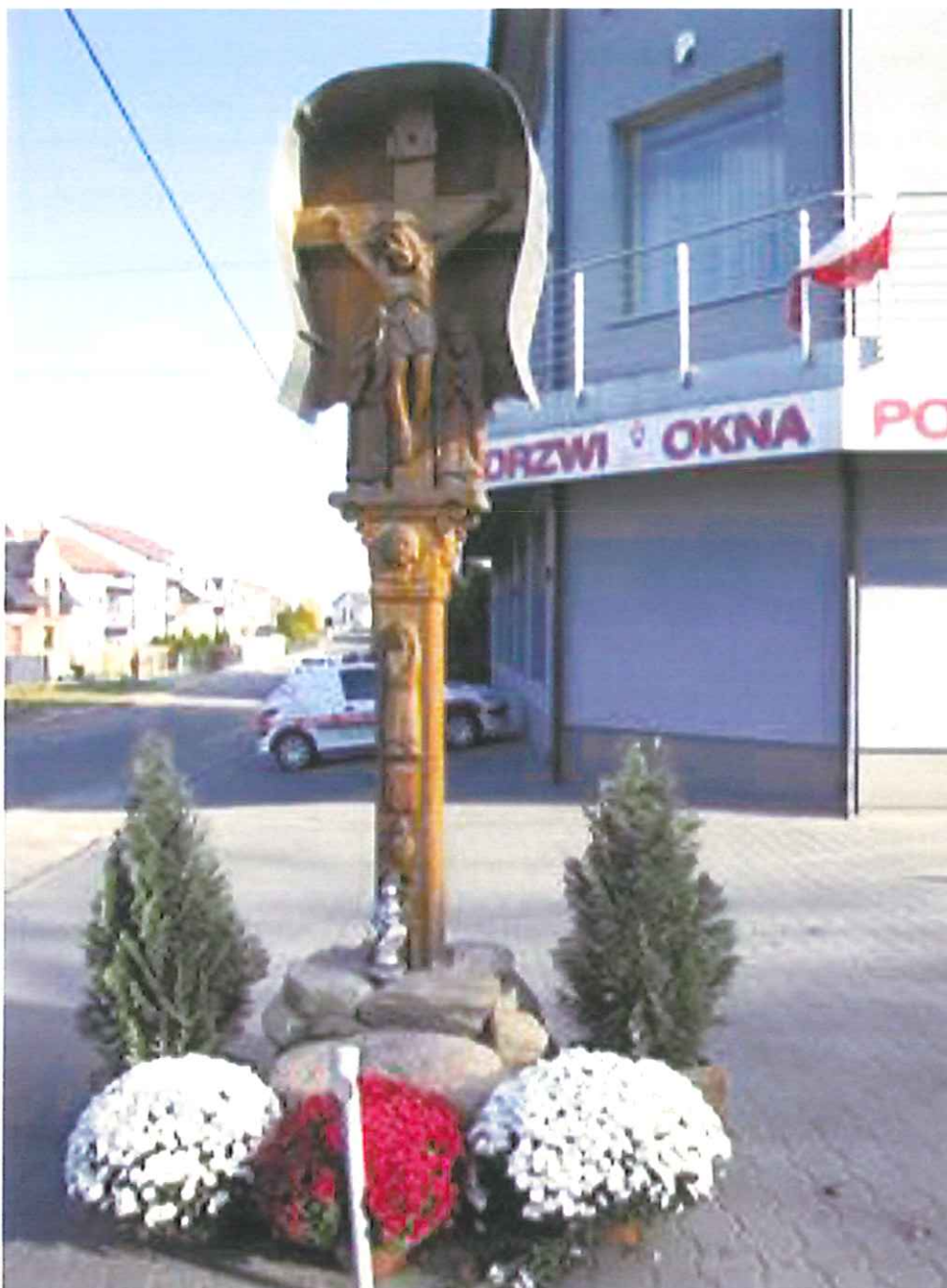
Fot.8. Proszowice, ul. Brodzińskiego. Replika drewnianego krucyfiks z figurami asystencyjnymi. Zdjęcie archiwalne 2010 r.