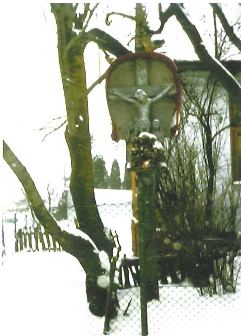
Fot.2. Proszowice, ul. Brodzińskiego. Drewniany krucyfiks z figurami asystencyjnymi. Fragment. Zdjęcie archiwalne, lata 1960-1970.